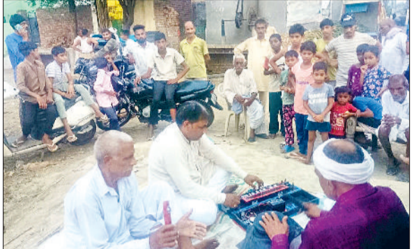
रोहतक। लोगों को सरकार की योजनाओं के बारे में जानकारी देते हुए भजन प्रचारक।