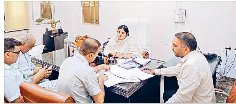
रोहतक। कृषि एवं किसान कल्याण विभाग के उप निदेशक कार्यालय पर छापेमारी के दौरान कामगजों की जांच करती सीएम फ्लाईंग की टीम।