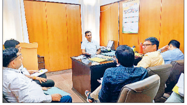
रोहतक। सफाई को लेकर अधिकारियों के साथ बैठक करते संयुक्त आयुक्त।

कर्मचारियों को निर्देश दिए निरीक्षण कर सफाई कि वे अपने-अपने वार्डों में निरंतर व्यवस्था सुनिश्चित करें।