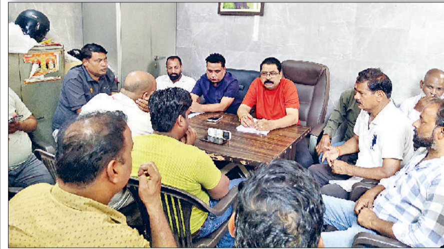
रोहतक। मीटिंग करते नगर पालिका कर्मचारी संघ के सदस्य।

कहा-सरकार कर रही मांगों की अनदेखी, कर्मचारी विरोधी नीतियों के बारे में चर्चा की जाएगी